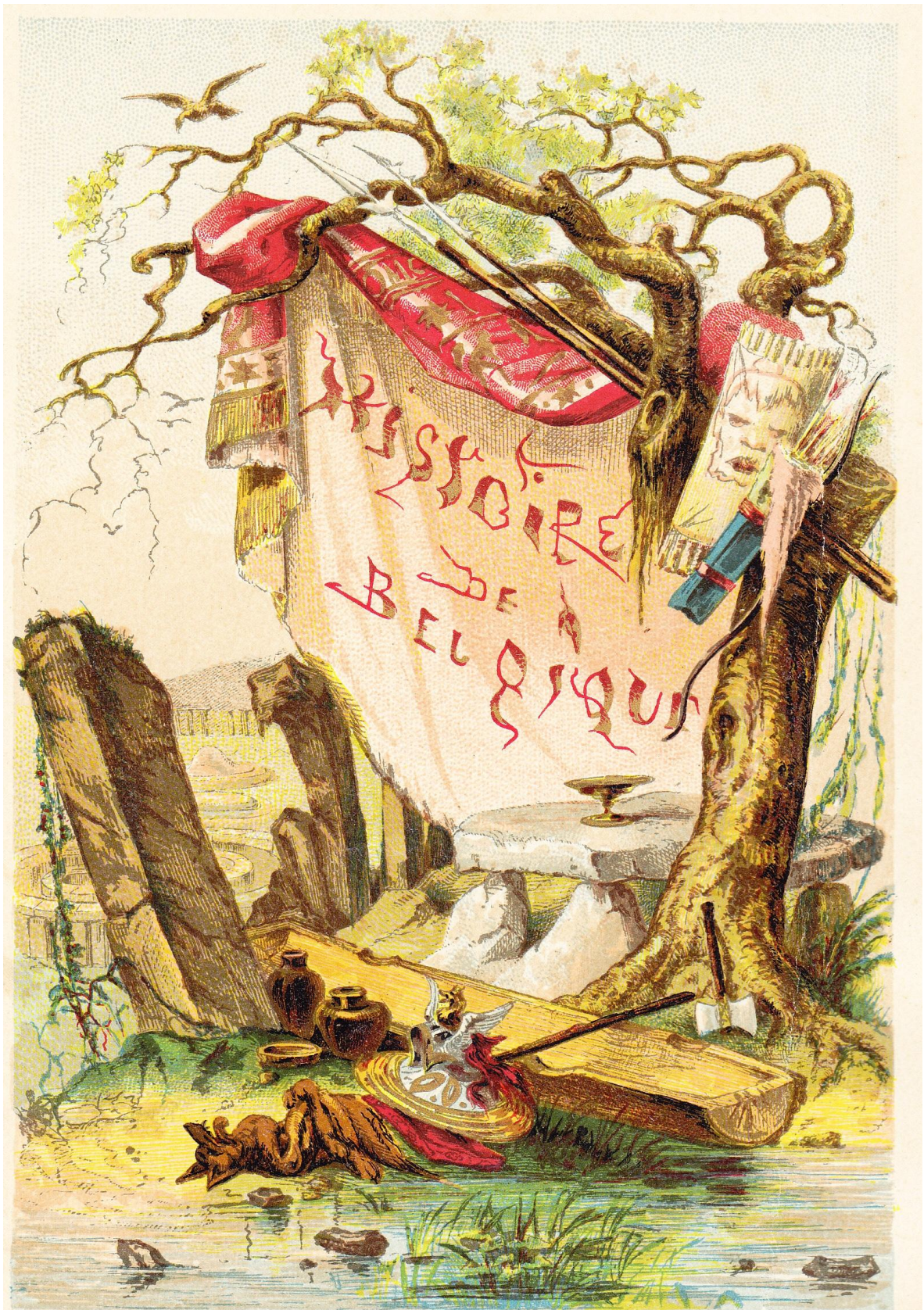
G. Severeys, Chromolith.

ARMES, USTENSILES ET MONUMENTS GERMAINS.