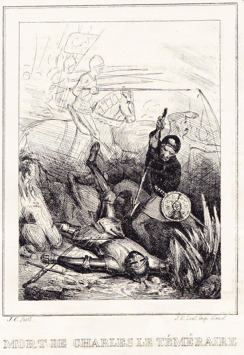
“Mort de Charles le Téméraire”

Il nous a semblé intéressant de proposer, à titre de comparaison, des gravures relatives au même thème qu'ont réalisées ultérieurement certains de ses contemporains.