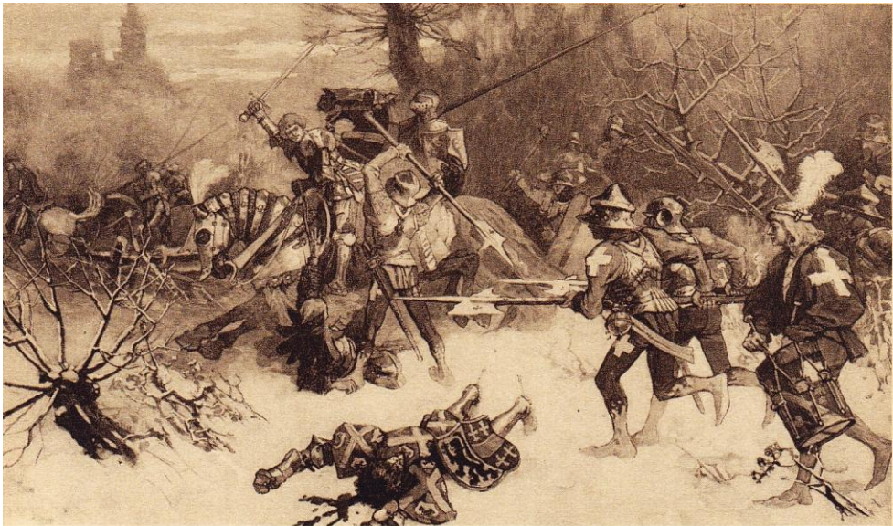
IX - 9 — Mort du Téméraire à Nancy — Dessin de Ad. Closs.

Tussen bladzijden 563-564 van MOKE ; Geïllustreerde geschiedenis van België ).