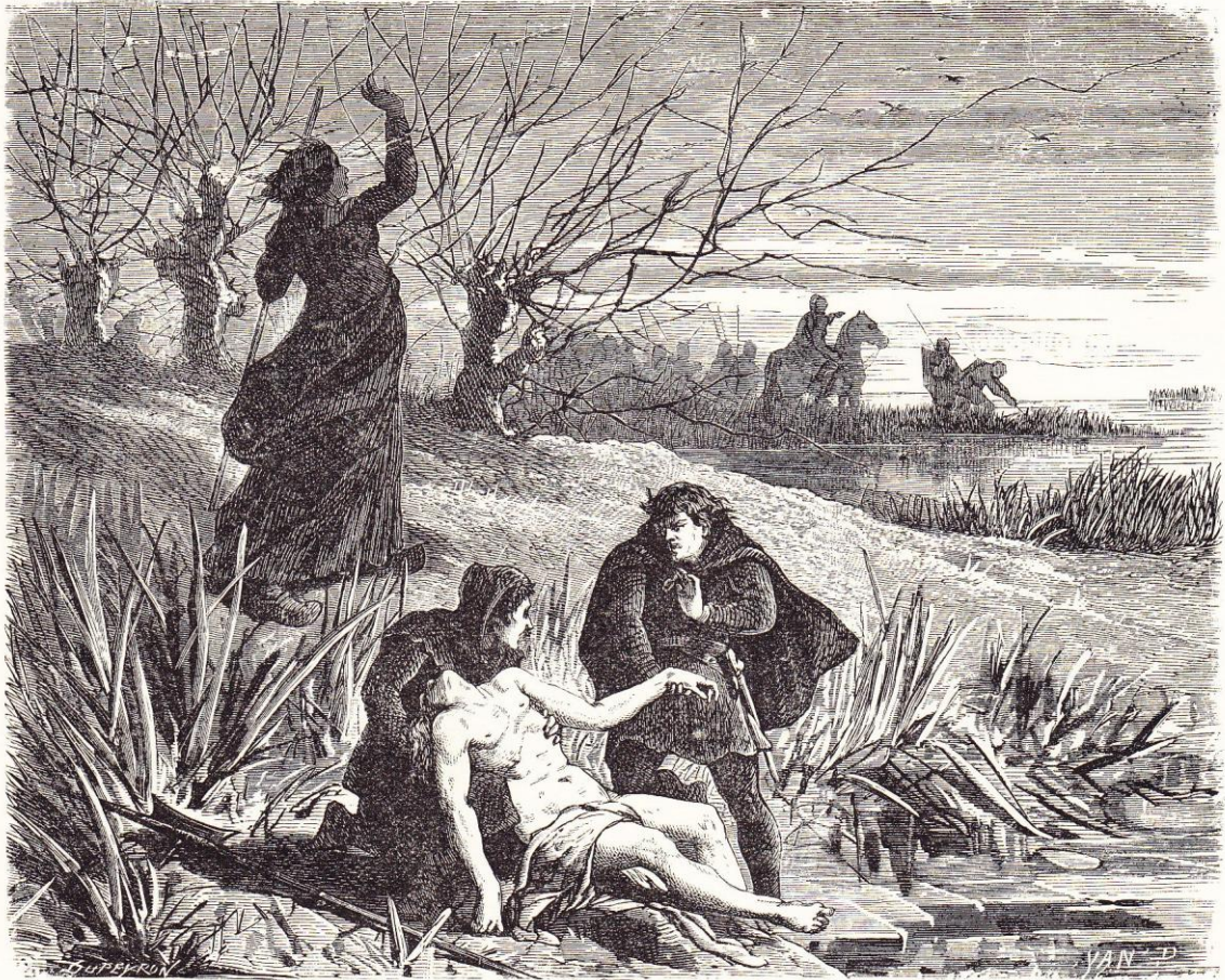
ONTDEKKING VAN HET LIJK VAN KAREL DEN STOUTEN.

Tussen bladzijden 563-564 van MOKE ; Geïllustreerde geschiedenis van België ).