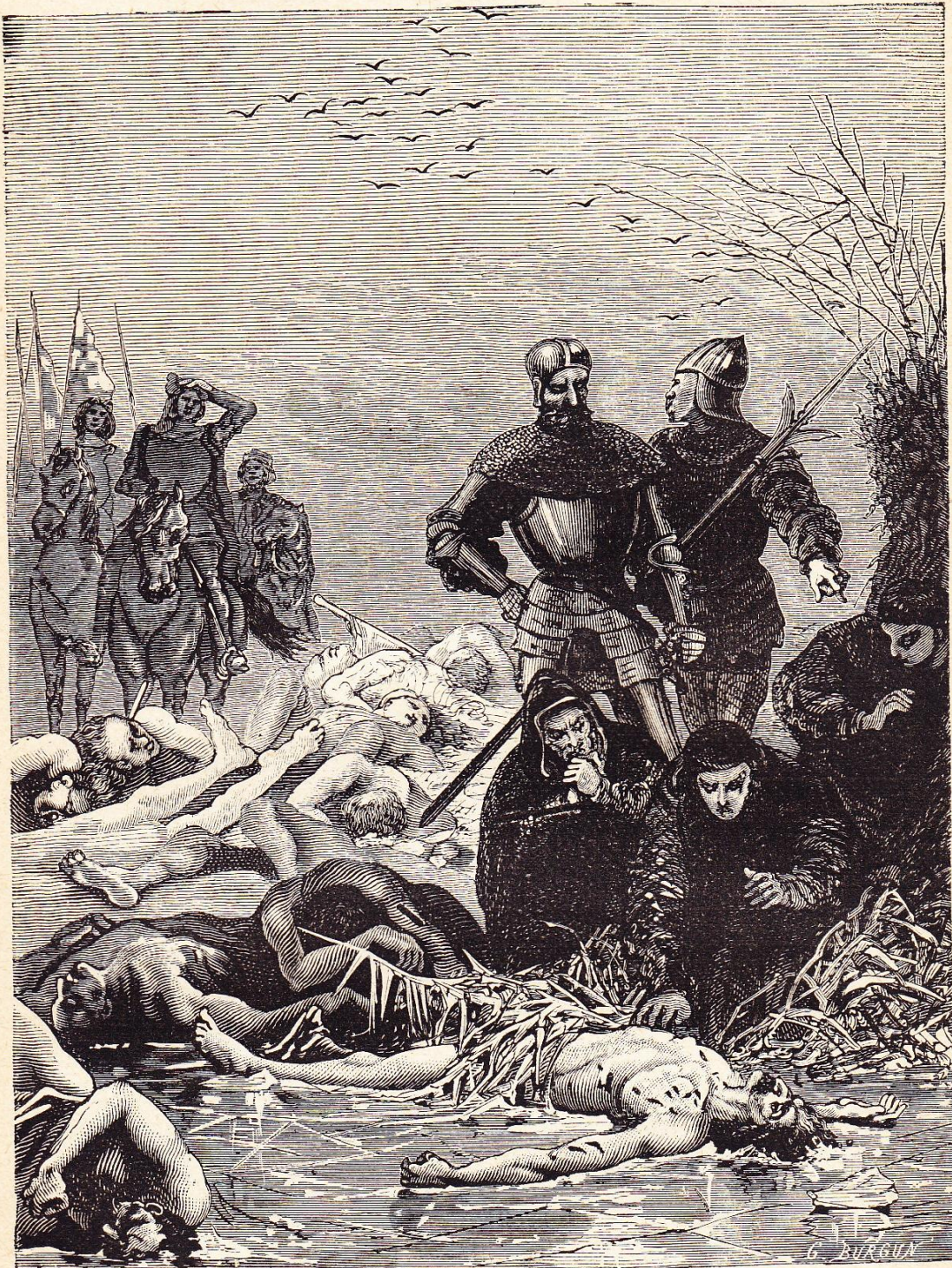
Le cadavre de Charles le Téméraire découvert sur le champ de bataille de Nancy.

à la page 224 (1867 *) de MOKE ; Abrégé de l'histoire de Belgique (1880 ?).