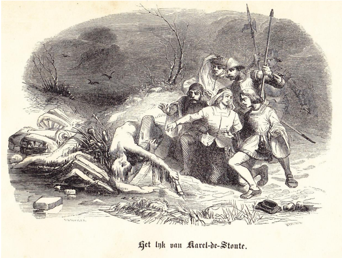
Het lyk van Karel-de-Stoute.

Tussen bladzijden 330-331 van CONSCIENCE , Geschiedenis van België (1845).