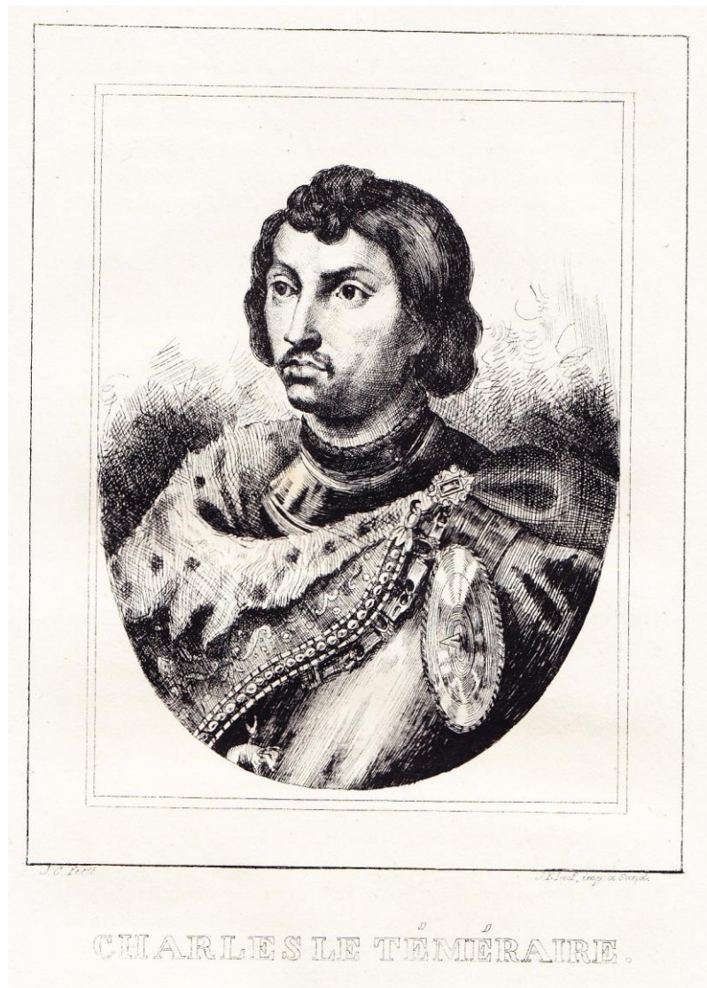
“Charles le Téméraire”

Il nous a semblé intéressant de proposer, à titre de comparaison, des gravures relatives au même thème qu'ont réalisées ultérieurement certains de ses contemporains.