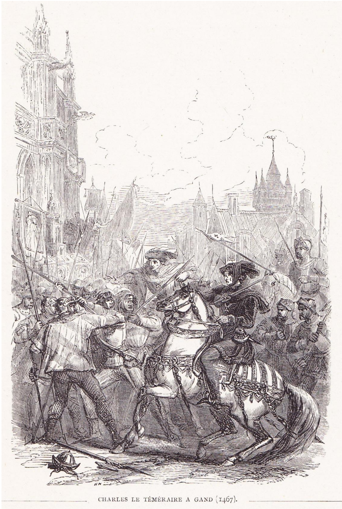
CHARLES LE TÊMÉRAIRE A GAND (1467).

à la page 67 de JUSTE ; Histoire de Belgique , (1868 ?), T. 2 .