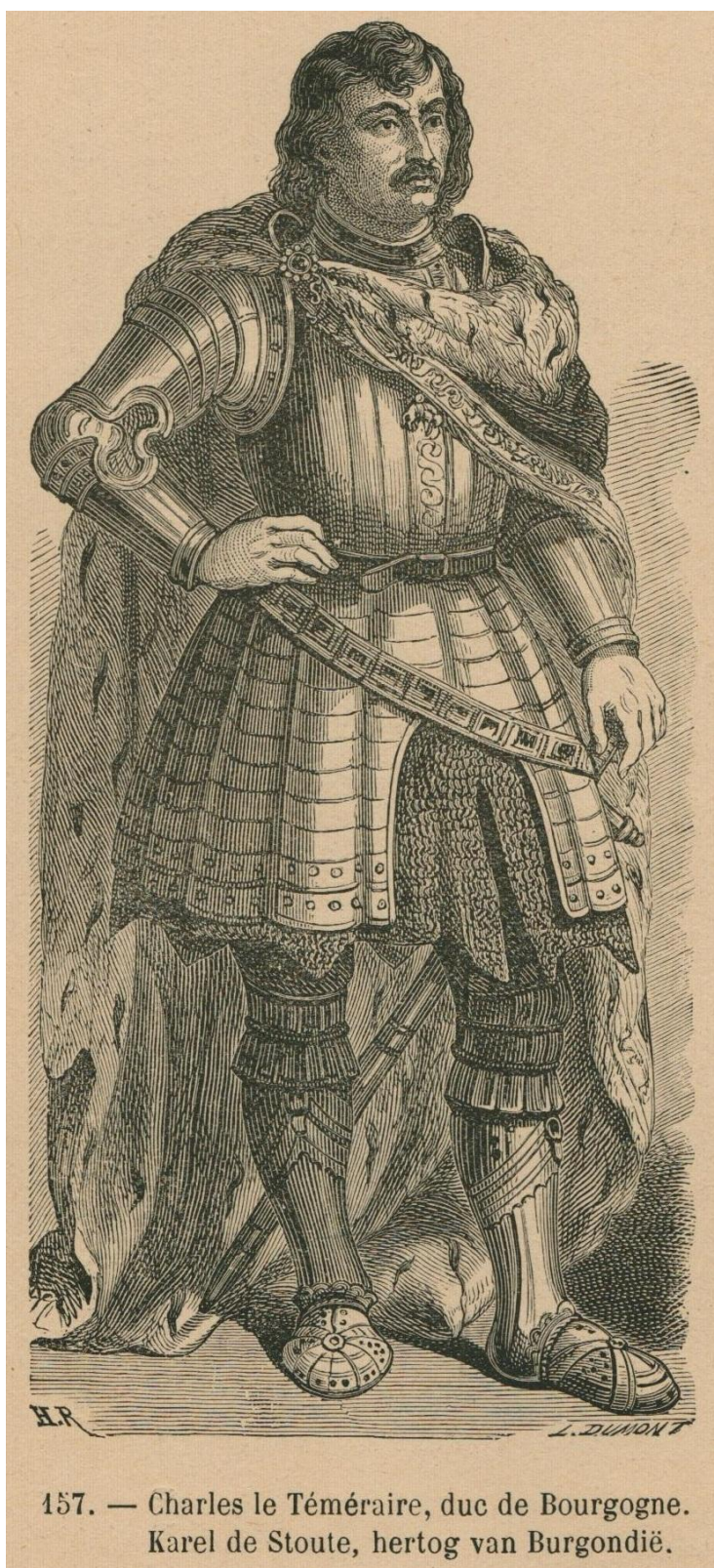
157. — Charles le Téméraire, duc de Bourgogne. Karel de Stoute, hertog van Burgondië.

à la page 84 (1867*) à de SEVERIN , Histoire de la Belgique en images / Geschiedenis van België in prenten.