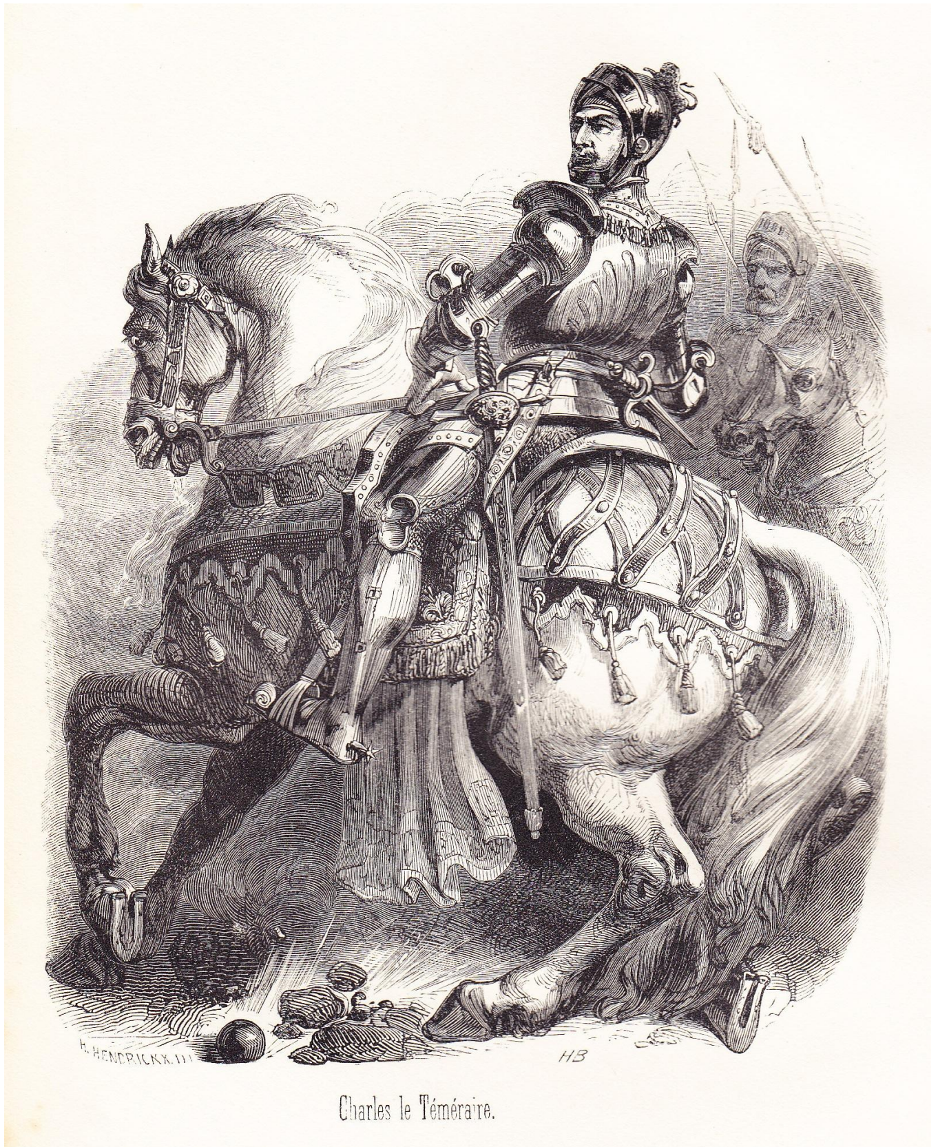
Charles le Téméraire.

Entre les pages 160-161 de Belges illustres 1 (1844).