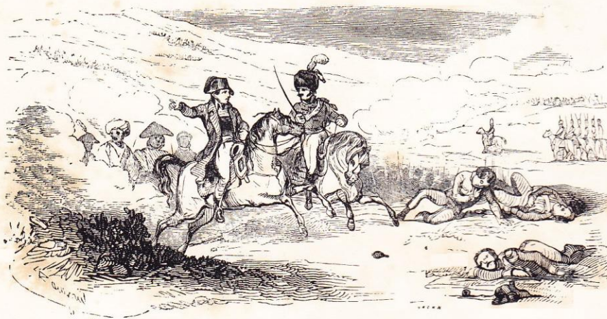
Bataille de Marengo.

Figure aussi entre pages 114 et 115 du Musée de la Révolution française (éd. belge).