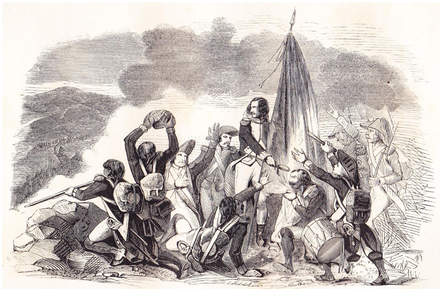
Bataille de Montenotte.