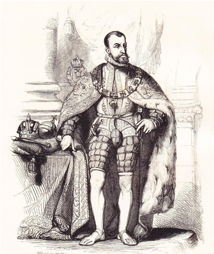
CHARLES - QUINT.