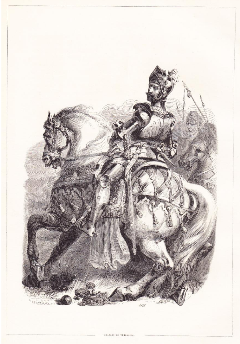
CHARLES LE TÈMÉRAIRE.