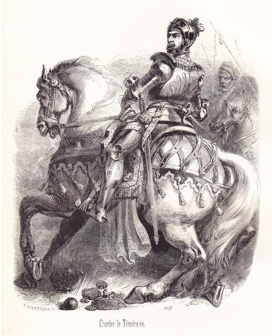
Charles le Téméraire.