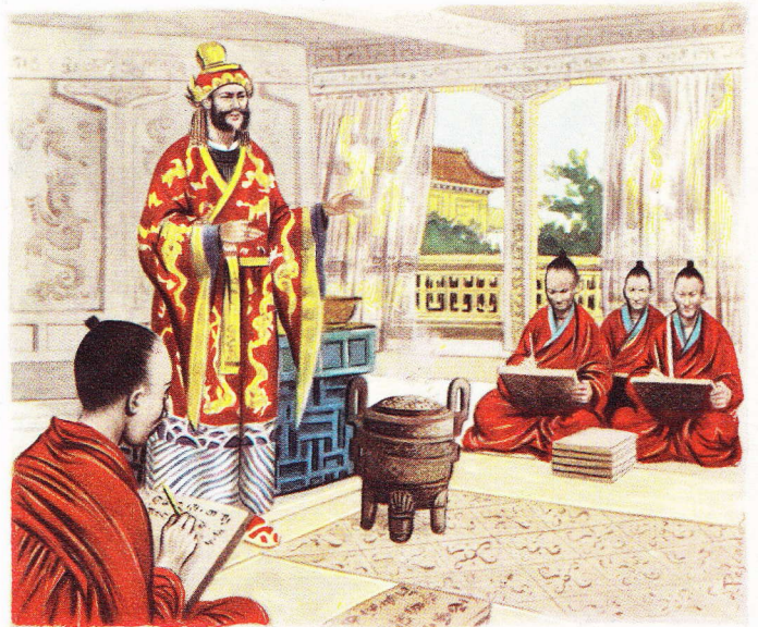
L'Empereur Fu Hsi dicte ses lois à un groupe de scribes. Cela se passe vers l'an 2000 av. J.-C.

Aussi, dans la mythologie chinoise trouvons-nous Pam-Ku, le premier homme, que l'on peut comparer à l'Adam de la tradition biblique, et un demi-dieu, considéré comme l'inventeur du feu, de l'agriculture et des arts, Sui Yen, qui s'apparente au Galgamesh des Sumériens, au Prométhée des Grecs.