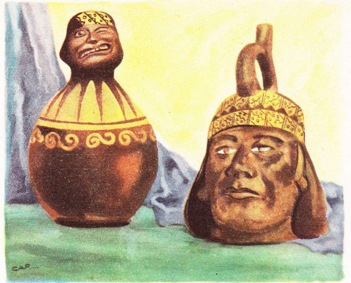
Deux vases étranges, dus aux Incas. Ils représentent la figure de Trujillo. La netteté et le réalisme des formes leur donnent un aspect moderne inattendu.

Cette faïence commune fut introduite en Italie au XV ème siècle, par des potiers des Iles Baléares selon les uns, par