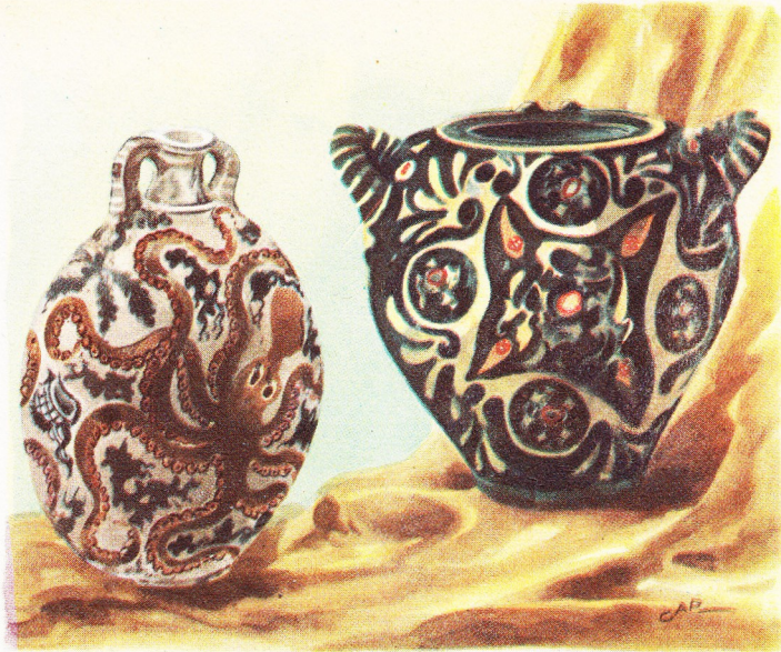
A gauche, vase crétois du XVI ème siècle av. J.-C. décoré de rochers, de coquilles, de plantes marines. A droite autre vase crétois de l'époque minoïque