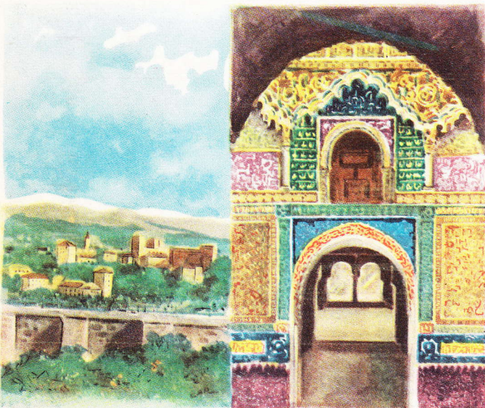
Mohamed ben Alaman fit construire à Grenade, au XIII ème siècle le palais de l'Alhambra, rehaussé d'ornements de briques émaillées. Au-dessus de l'ogive, on admirera la délicatesse des arabesques.

Quant à la porcelaine, c'est au XVI ème siècle que les navigateurs portugais découvrirent en Chine son existence.