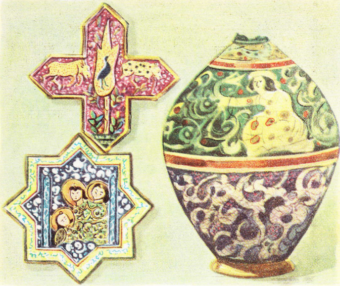
Des centaines de ces plaques (à gauche) posées les unes contre les autres, formaient une sorte de mosaïque, dont resplendissaient les palais des Rois de Perse.

naire avant J. C. Leurs dessins et leurs couleurs ne nous en surprennent que davantage, par leur modernisme! Les poteries de Samos — amphores, coupes, plats — portaient le plus souvent des dessins rouges sur un fond noir ou bleu.