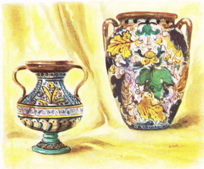
Deux vases polychromes, de facture antique, mais dont les couleurs éclatantes ont bravé les siècles.

De là à conclure que la première coupe grossière qui sortit des mains du potier fut le premier objet... de luxe.