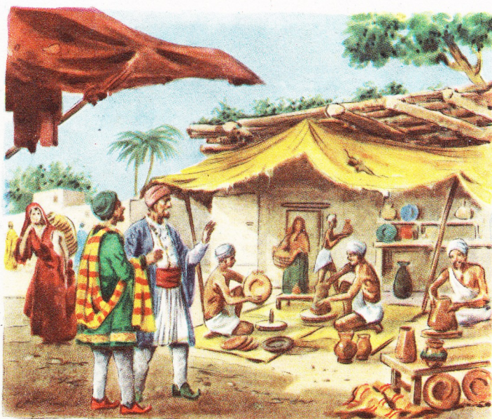
Boutique d'un potier de l'antique Perse. La machine composée d'une roue mue par une pédale était encore ignorée et l'artisan travaillait avec ses mains.

En fouillant profondément dans le sol, les archéologues ont mis à jour les vestiges de cités lacustres, d'habitations presque entièrement disparues, et aussi des fragments de terre cuite, de vases, d'amphores, qu'ont fait durcir des feux éteints depuis des millénaires. Ce sont, avec les pierres taillées, les seuls objets de l'époque néolithique dont le temps n'ait pas eu raison, les documents précieux d'une civilisation d'où lentement sont sortis les progrès techniques dont nous sommes si fiers aujourd'hui.