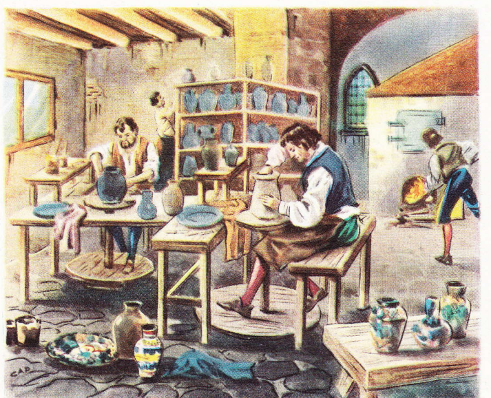
Un ancien atelier de céramique à Vallauris (Alpes Maritimes). De nos jours encore, de semblables poteries sont recherchées dans tous les pays du monde.