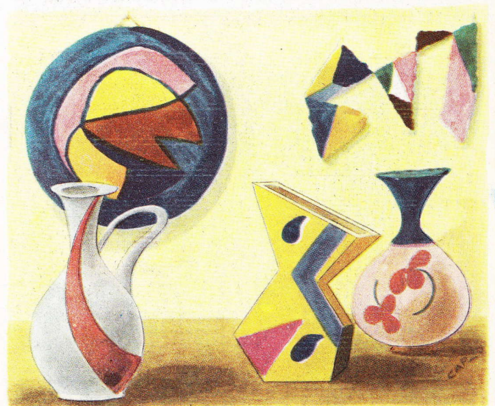
Deux spécimens de céramique moderne, caractérisée par l'étrangeté des formes et la stylisation des ornements. Cependant, l'inspiration de la Grèce (à gauche) et du Pérou (à droite) y est assez fortement marquée.