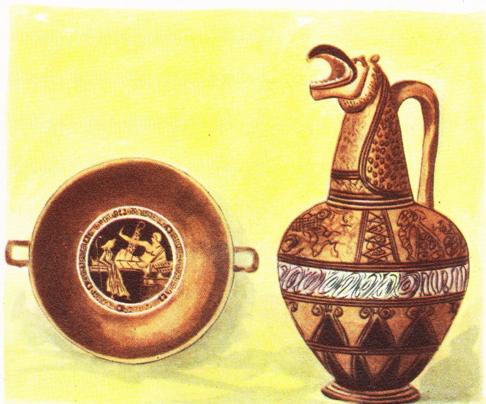
Récipient à tête de griffon, et coupe dont la décoration témoigne de la magnifique production des céramistes crétois de l'époque classique (IX ème au VII ème siècle av. J.-C.).