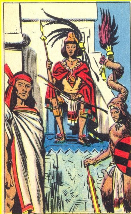
2. - UN PAYS HALLUCINANT

E N 1519, le gouverneur espagnol de Cuba, Velasquez, autorisa un de ses officiers, Fernand Cortez, à quitter l'île pour aller explorer un pays mystérieux, appelé Anahuac, « proche de l'eau », c'est-à-dire le Mexique. Cortez y débarqua avec 300 hommes, 13 arquebuses, 10 canons et 16 chevaux. Il brûla ses vaisseaux, fonda Vera Cruz et pénétra dans le pays. Un pays hallucinant !