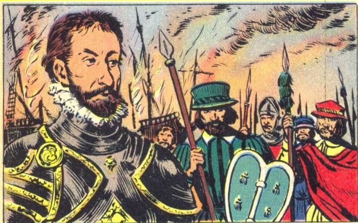
1. - HERNANDO CORTEZ

L ES Espagnols étaient arrivés trop tard pour s'assurer le marché des épices. Et cela à cause de ce continent inattendu qu'il avait fallu contourner. Il ne leur restait qu'une chose à faire : conquérir ce continent. On n'y trouverait pas d'épices, mais on y trouverait — grands dieux ! c'était affolant — de l'or, oui de l'or ! C'était le pays de l'or ! El Dorado ! En avant !