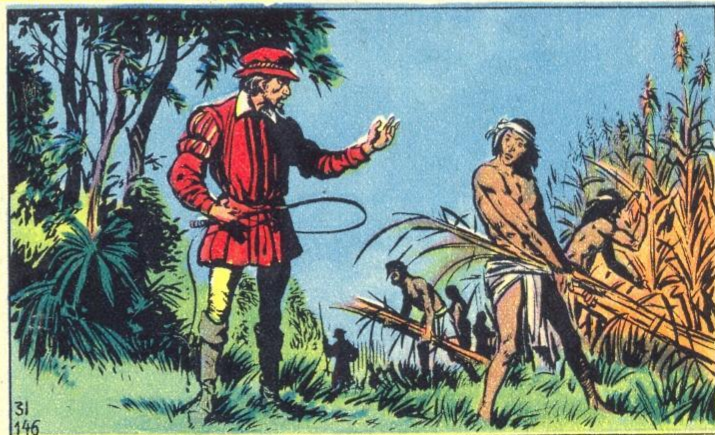
5. - L'AMERIQUE ESPAGNOLE

L ES Espagnols occupèrent toute l'Amérique, de la Floride à la Terre de Feu, sauf le Brésil. Ils en exploitèrent les mines d'or et d'argent, les fausses mines d'argent de Potosi. De Solis découvrit le fleuve de l'Argent — la Plata — et Mendoza le pays de l'Argent, l'Argentine. Les indigènes furent fort maltraités et décimés dans les « repartimientos » des plantations, en dépit des protestations de l'évêque Las Casas.