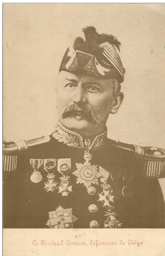
Le Général Lemman, défenseur de Liège

Les marchands de décorations et de petits drapeaux continuent leur commerce malgré les ondées. Une nouvelle carte postale a fait son apparition : c'est le portrait du général Leman, le héros de Liège.