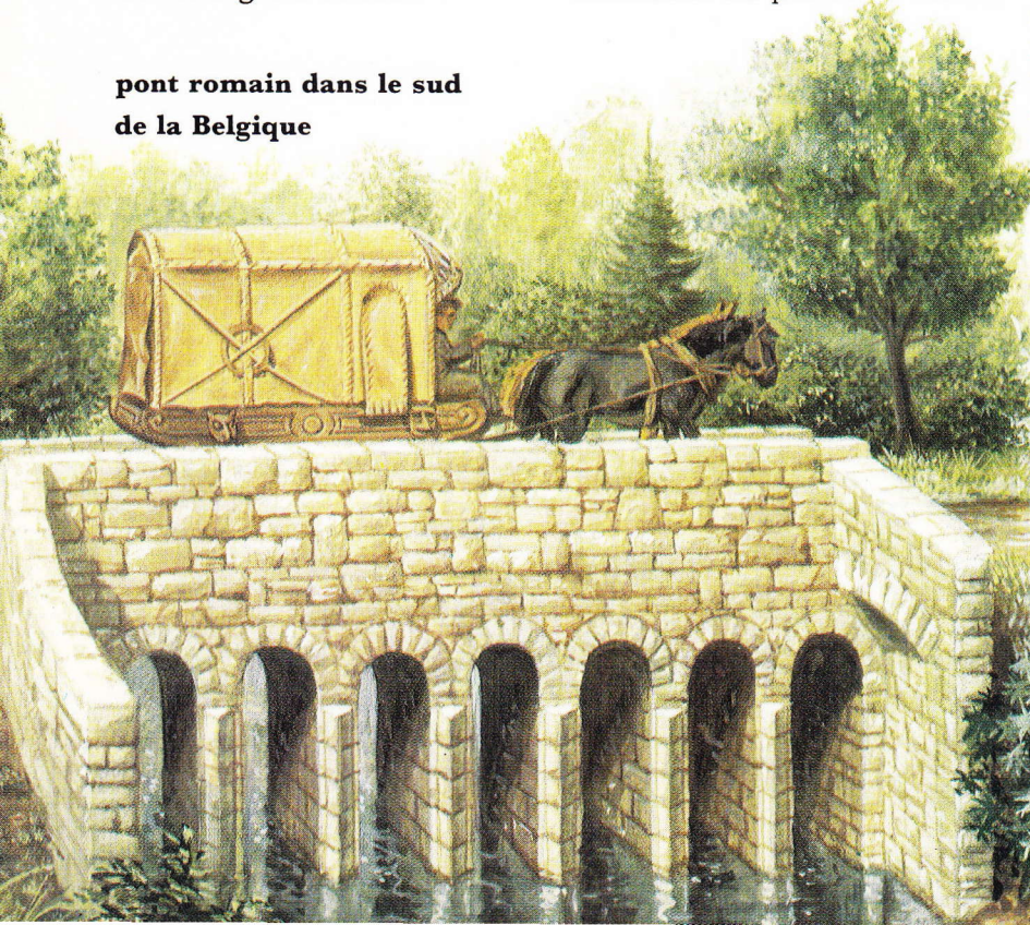
pont romain dans le sud de la Belgique

Le fait capital de l'histoire de Rome, sans lequel on ne peut pas comprendre sa civilisation, est la conquête du bassin méditerranéen et plus tard des territoires situés à l'est et au nord de celui-ci. Du 3 e siècle av. J.C. jusqu'au 5 e siècle de notre ère, la civilisation romaine s'est répandue sur une grande partie de l'Europe. La conquête de l'Italie a duré environ deux siècles: de 500 à 300 av. J.C. environ. Ensuite Rome a déployé sa puissance, vers le nord jusqu'aux massifs d'Ecosse, vers l'est jusqu'à l'embouchure du Danube et au sud jusqu'aux cataractes du Nil et aux plateaux du Maroc. Cette conquête s'est faite très lentement, mais c'est cette lenteur même qui explique son succès. Elle était, en effet, le résultat de l'effort de plusieurs générations, de sorte qu'entretemps, la civilisation s'était progressivement implantée. De plus, la romanisation fut poursuivie avec la