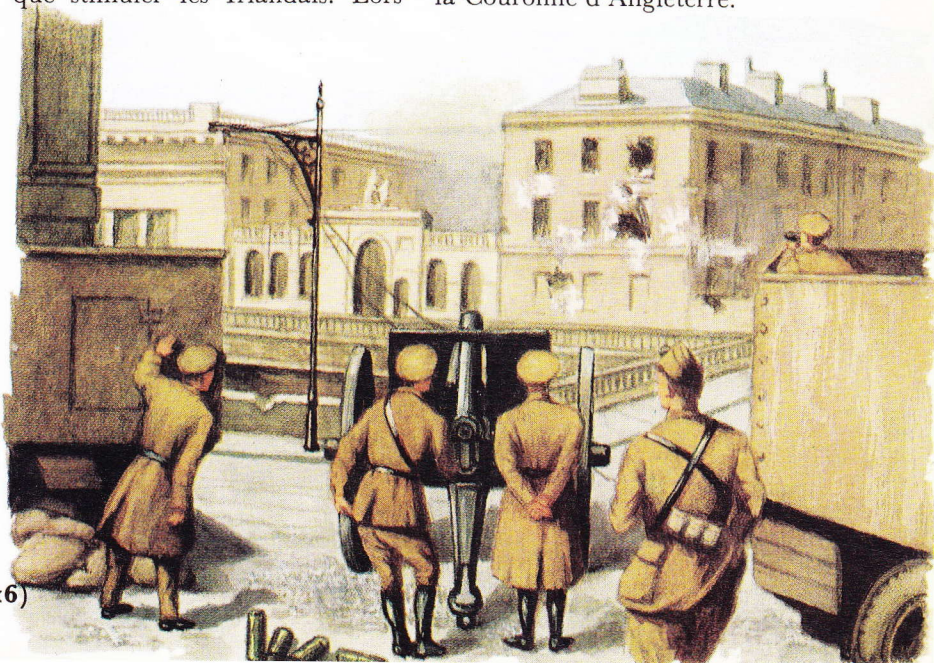
combats à Dublin (1916)

de la première Guerre mondiale fut votée la loi sur l'autonomie, mais elle ne fut pas mise immédiatement en vigueur. Une nouvelle organisation naquit, celle des Sinn Féiners, qui voulait rompre délibérément avec l'Angleterre. La bombe éclata après la guerre. En 1922 Collins et de Valera élaborèrent finalement la constitution et ensuite le développement de l'Etat libre d'Irlande, dont l'Ulster ne fait pas partie. Néanmoins jusqu'en 1948 subsistèrent encore diverses obligations envers la Couronne d'Angleterre.