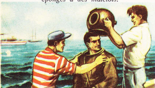
Un scaphandrier revêt son costume de plongée.