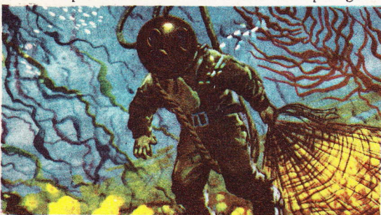
Les éponges sont détachées du fond marin auquel elles adhèrent.