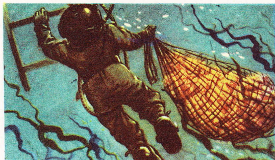
Quand son filet est plein, le pêcheur remonte à la surface.

Considérées naguère comme des végétaux, les éponges ont été rangées, par les naturalistes, parmi les agrégations d'animaux analogues à celles que nous offrent les polypes. Elles forment, sur le fond marin, un solide treillis de substance cornée, incrustée dans une matière gélatineuse, où l'on peut reconnaître un système digestif ramifié. A l'extérieur, l'éponge est percée de petits trous, ou pores. Les éponges se reproduisent par des divisions répétées, qui donnent naissance à un nombre d'individus à peine croyable.