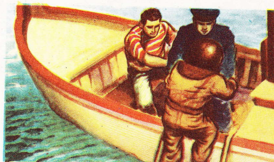
Un canot suit le scaphandrier durant tout son voyage sous les eaux.