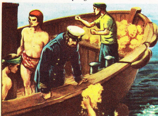
Un pêcheur, remonté à la surface, remet des éponges à des matelots.

La consommation des éponges est considérable dans le monde entier.