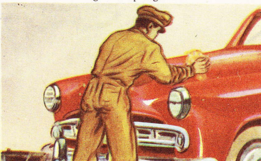
Une des nombreuses utilisations des éponges: le nettoyage des voitures.