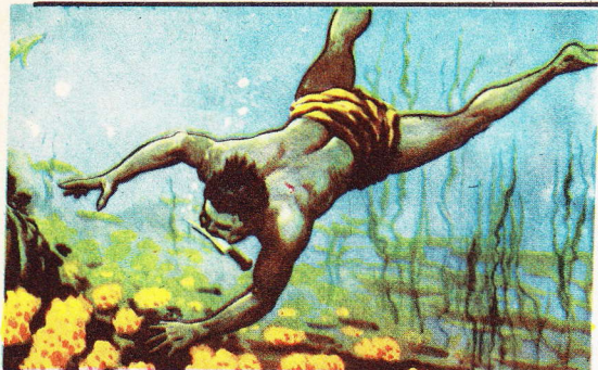
Plongée d'un esclave préposé à la pêche aux éponges.

Les éponges se trouvent dans toutes les mers, en bancs qui ne se situent pas, en général, au-dessous de 40 mètres de profondeur. Mais c'est surtout dans la Méditerranée, dans la Mer Rouge, dans la Mer des Caraïbes et dans les eaux australiennes qu'on les pêche. Cette pêche était, naguère encore une aventure fort dangereuse et, en tout cas, épuisante. Aujourd'hui, l'on a mis au point des procédés qui en ont entièrement transformé le caractère.