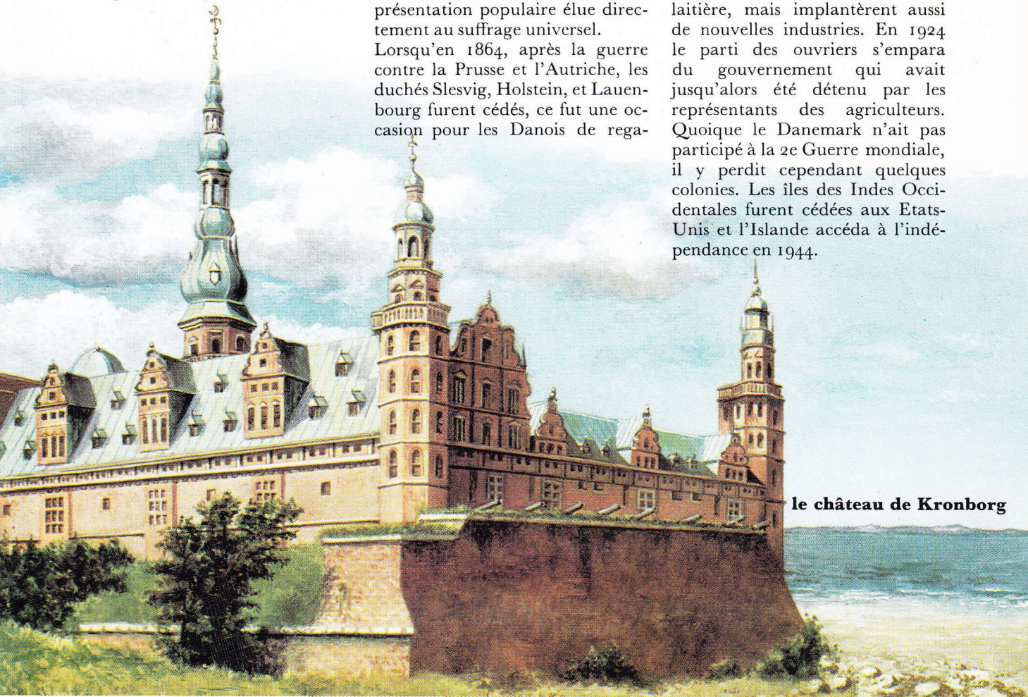
le château de Kronborg

gner sur le plan intérieur ce qu'ils avaient perdu à l'extérieur. Ils procédèrent à une nouvelle réforme agraire afin de pouvoir résister, à la fin du 19 e siècle, à la concurrence de l'étranger. Ils se consacrèrent surtout à l'élevage intensif et à la production laitière, mais implantèrent aussi de nouvelles industries. En 1924 le parti des ouvriers s'empara du gouvernement qui avait jusqu'alors été détenu par les représentants des agriculteurs. Quoique le Danemark n'ait pas participé à la 2 e Guerre mondiale, il y perdit cependant quelques colonies. Les îles des Indes Occidentales furent cédées aux Etats-Unis et l'Islande accéda à l'indépendance en 1944.