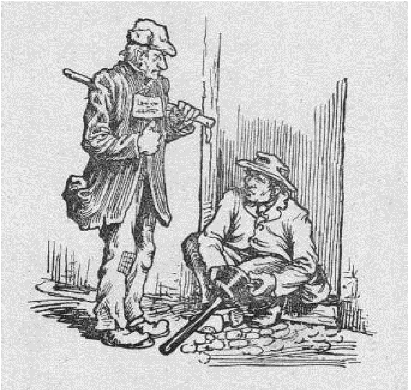
Pentekening bladzijde 15 / illustration page 15