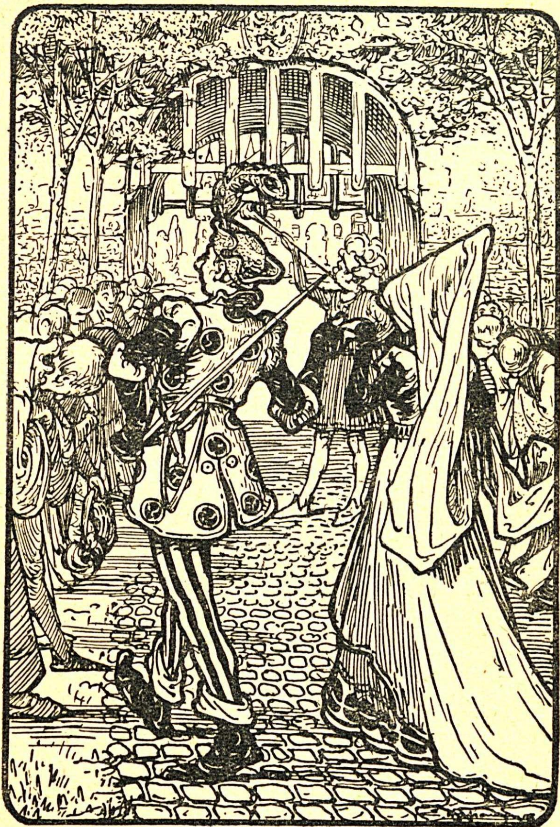
Blijde terugkeer van Jan Onversaagd met prinses Rozemarijntje aan het Hof.