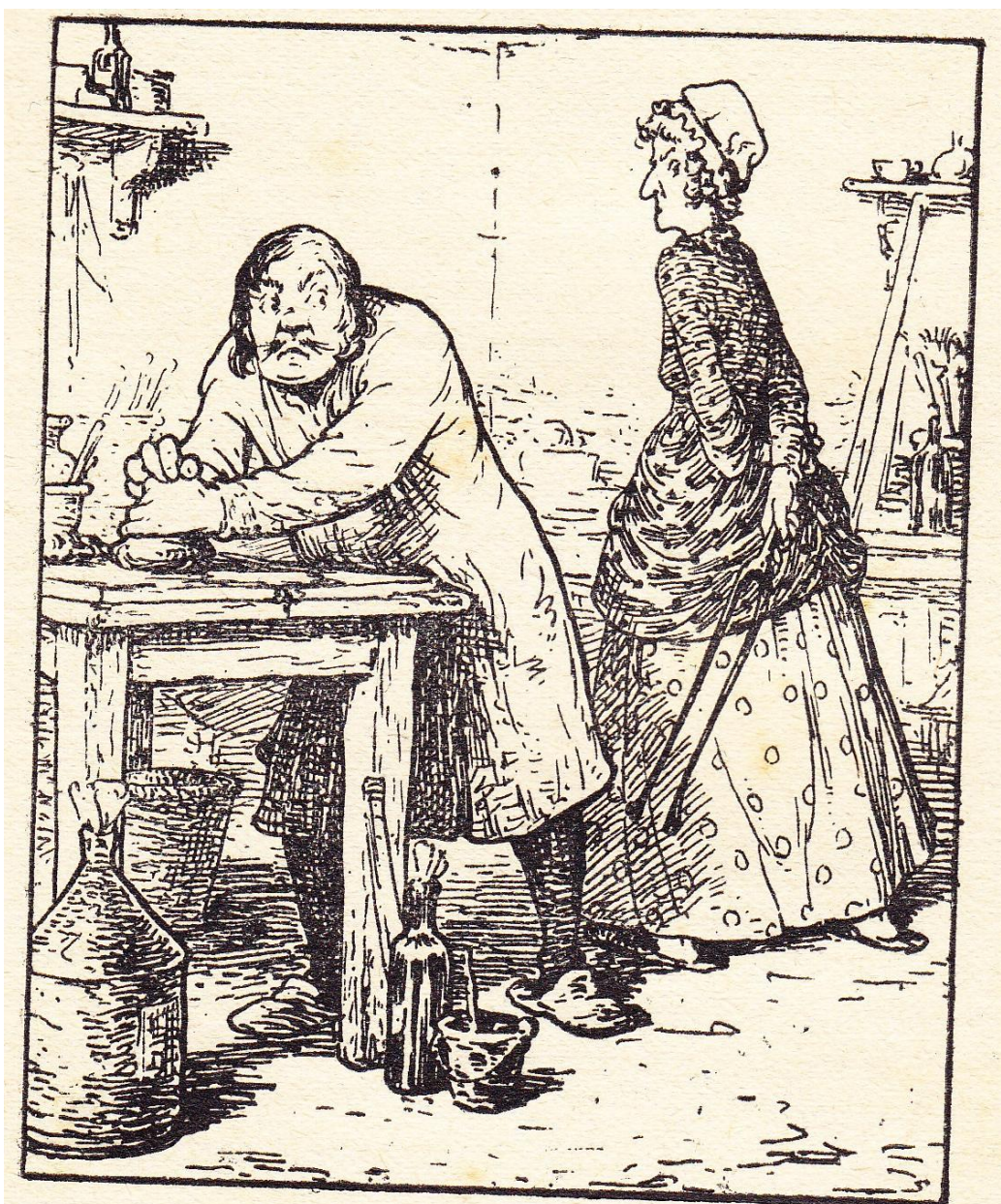
En dreigde met kooltang... (X)

Pentekening bladzijde 89 / illustration page 89 van de uitgave 1923 / de l'édition 1923 bladzijde 25 / illustration page 25 van de uitgave 1925 / de l'édition 1925 hoofdstuk X / chapitre X : « Naar boven, naar beneden »