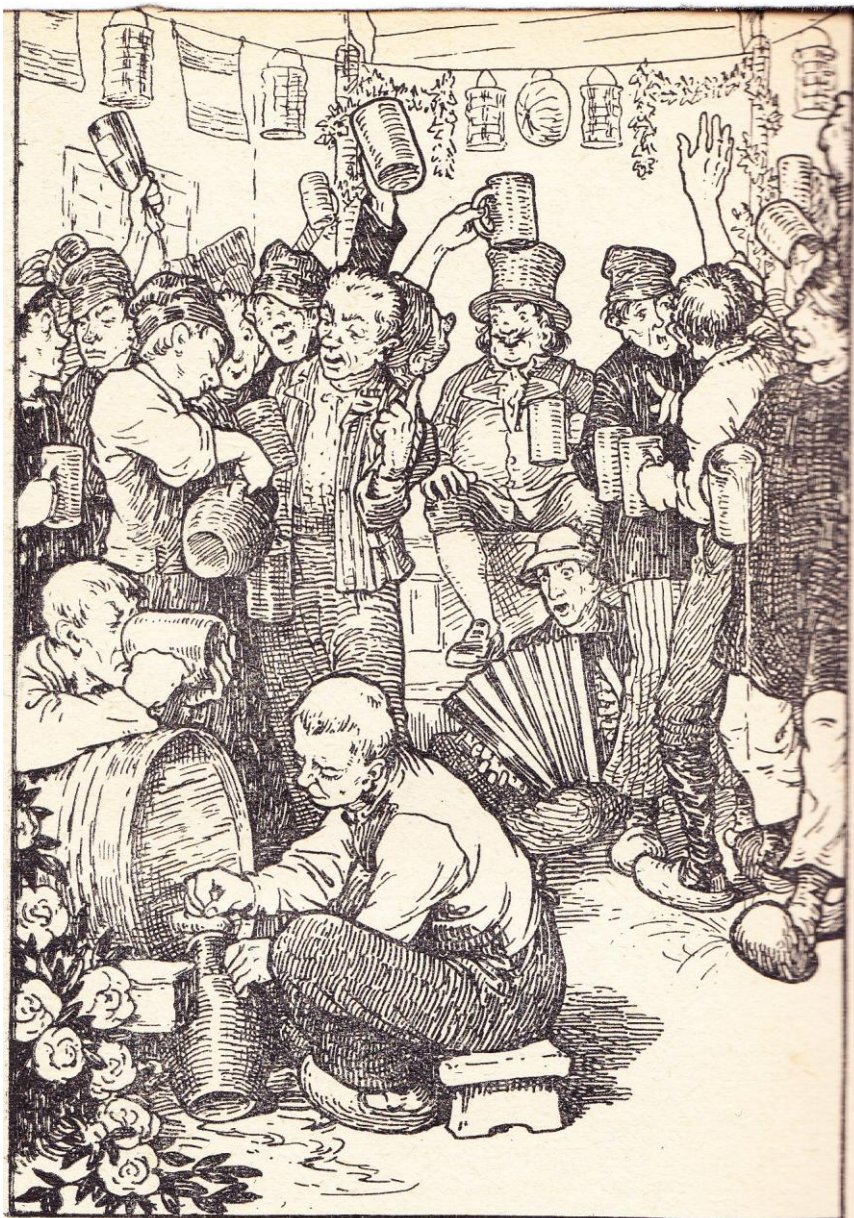
Men dronk honderd heilteugen op de gezondheid van den nieuwen raadsheer... (IX)

Pentekening bladzijde 81 / illustration page 81 van de uitgave 1923 / de l'édition 1923 bladzijde 94 / illustration page 94 van de uitgave 1925 / de l'édition 1925 hoofdstuk IX / chapitre IX : « De lange gewenschte dag »