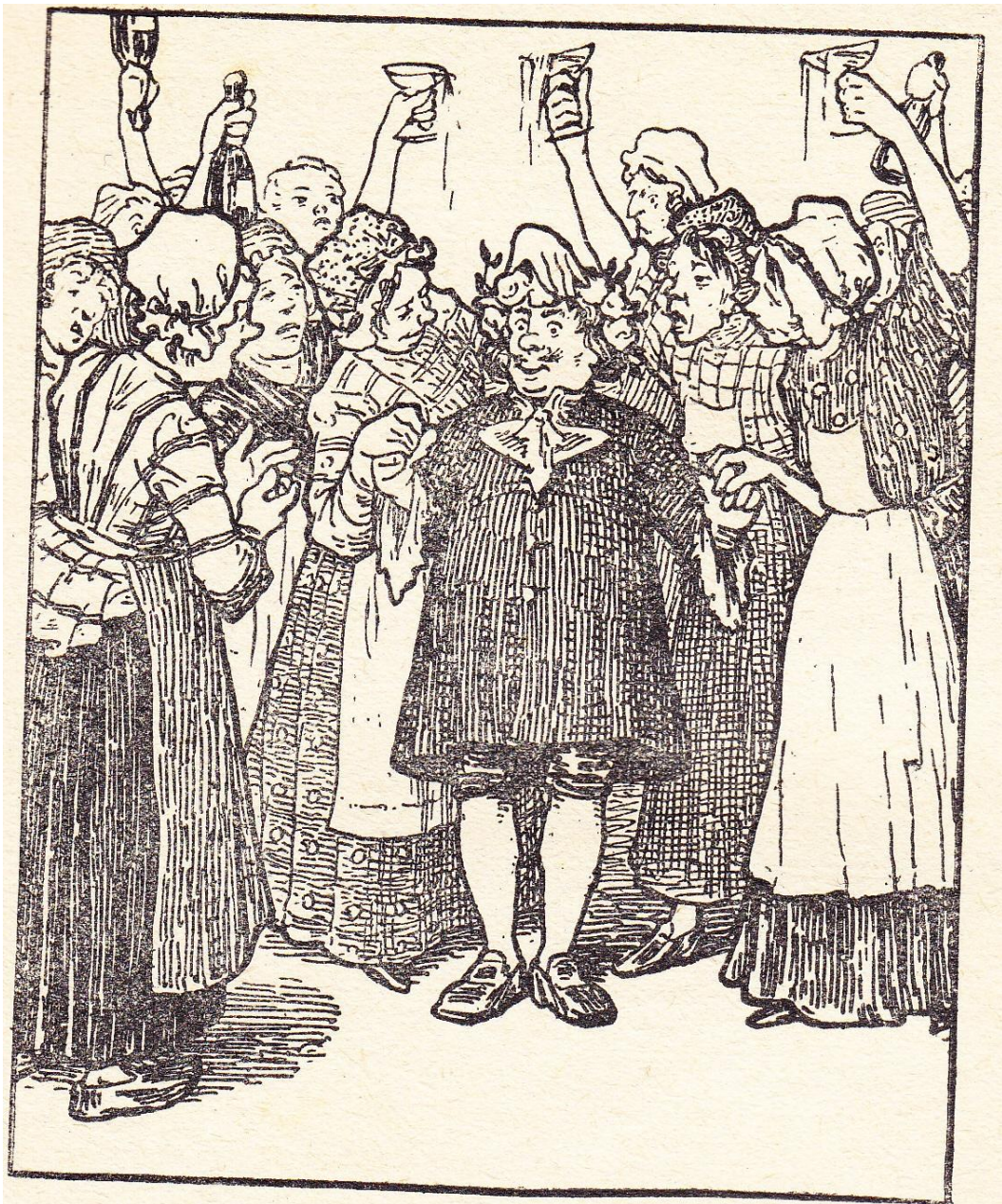
De gekroonde Klipper (VII)

Pentekening bladzijde 57 / illustration page 57 van de uitgave 1923 / de l'édition 1923 bladzijde 79 / illustration page 79 van de uitgave 1925 / de l'édition 1925 hoofdstuk VII / chapitre VII : « Op de Koffie / eerste bedrijf »