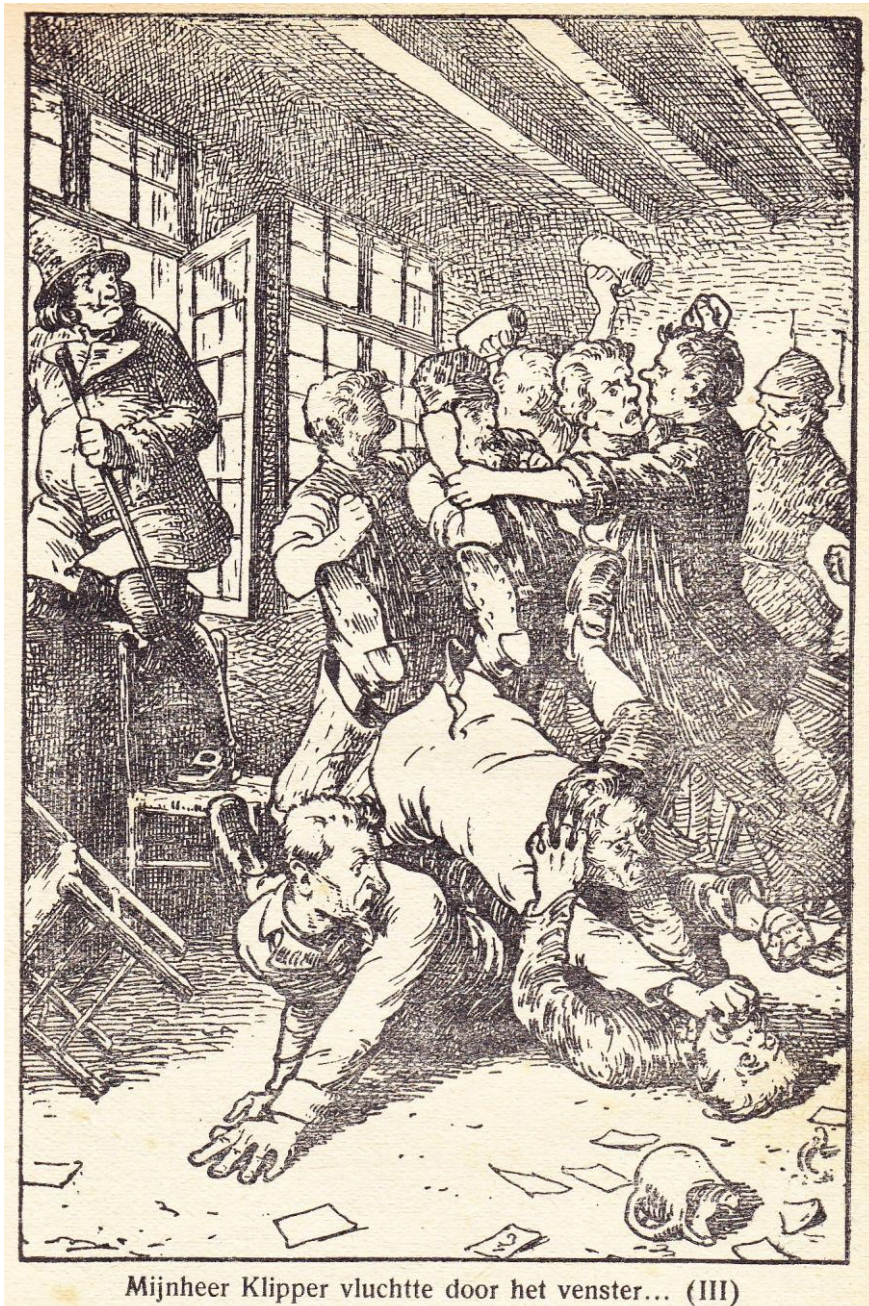
Mijnheer Klipper vluchtte door het venster... (III)

Pentekening bladzijde 7 / illustration page 7 van de uitgave 1923 / de l'édition 1923 hoofdstuk III / chapitre III : « Weerwolven en Heidedieven » bladzijde 45 / illustration page 45 van de uitgave 1925 / de l'édition 1925 hoofdstuk V / chapitre V : « Genoeglijke dagen van een kandidaat »