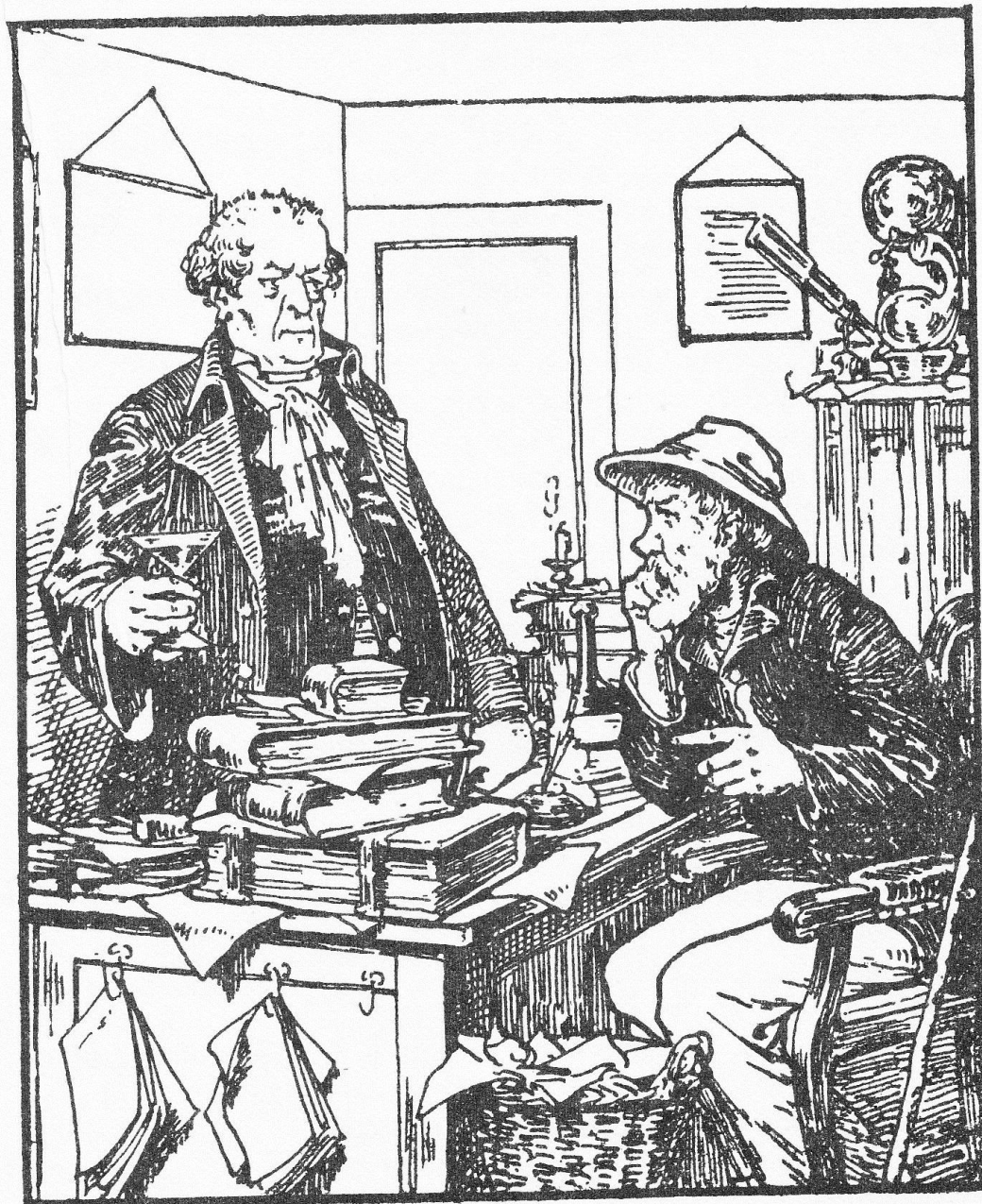
Pentekening bladzijde 167 / illustration page 167 van heruitgave (1976) bladzijde 49 / illustration page 49 van uitgave (1923) In hoofdstuk V : De rechtsgeleerde