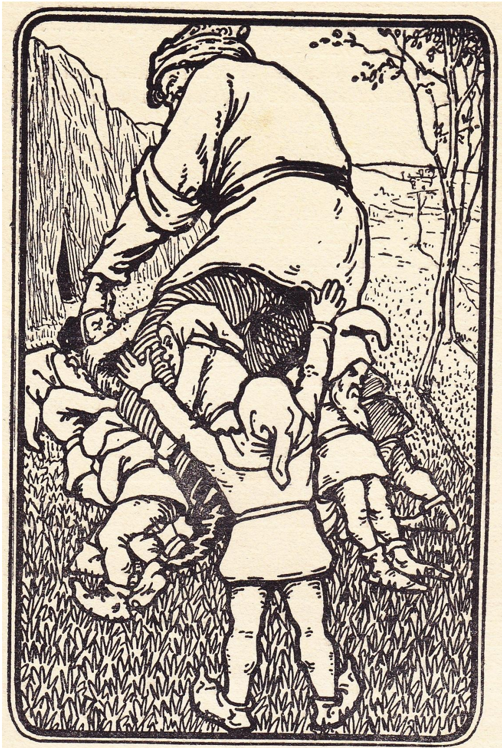
Pentekening bladzijde 7 / illustration page 7