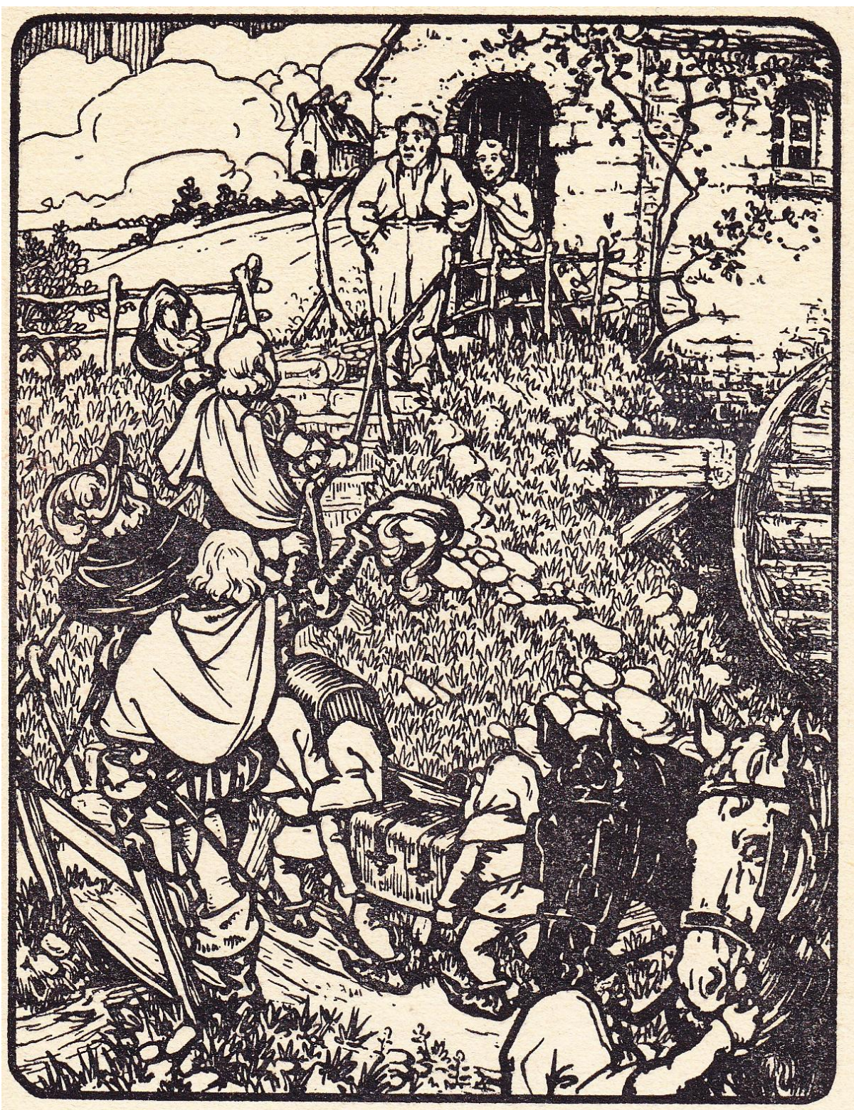
Pentekening bladzijde 15 / illustration page 15