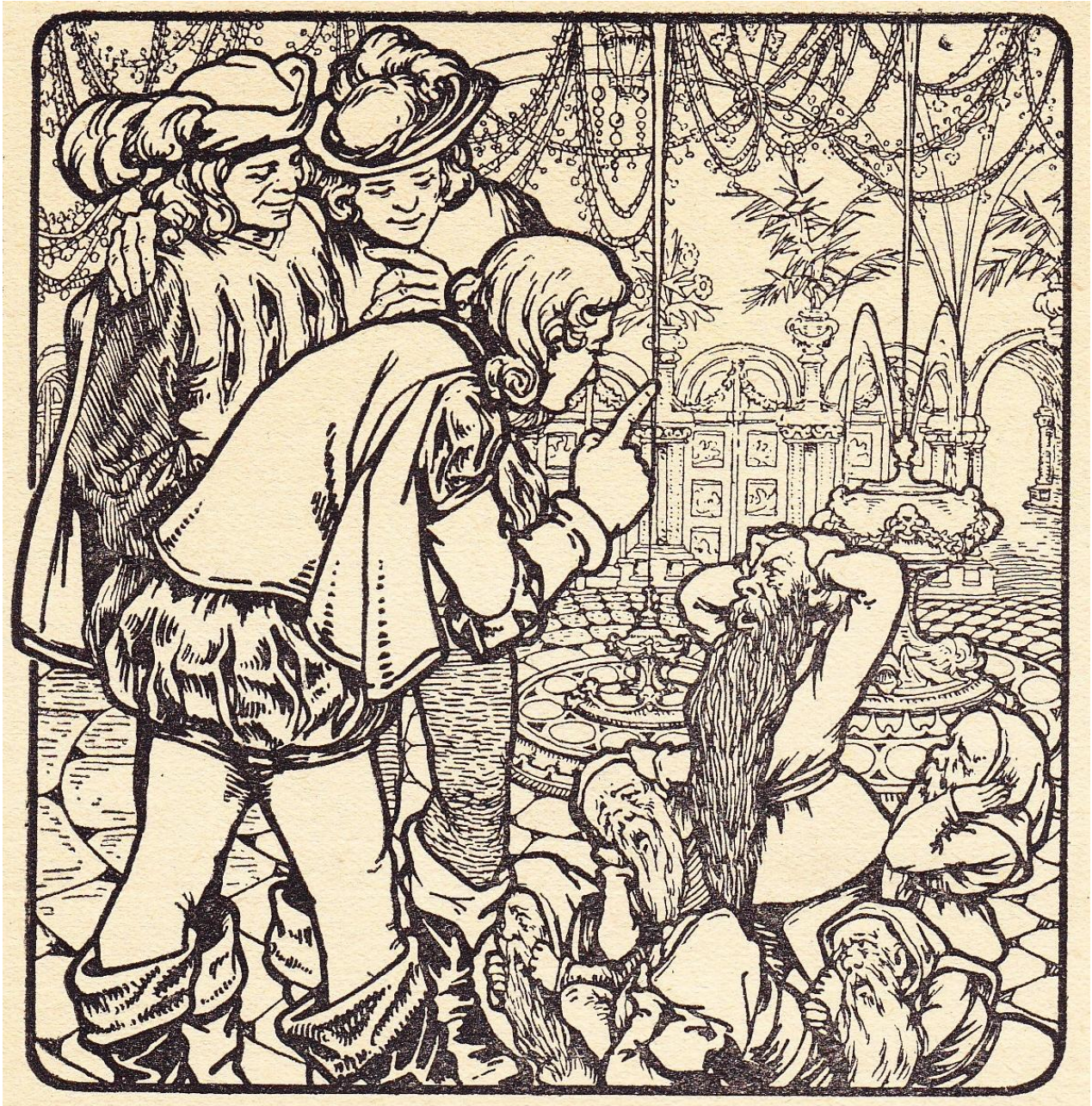
Pentekening bladzijde 13 / illustration page 13