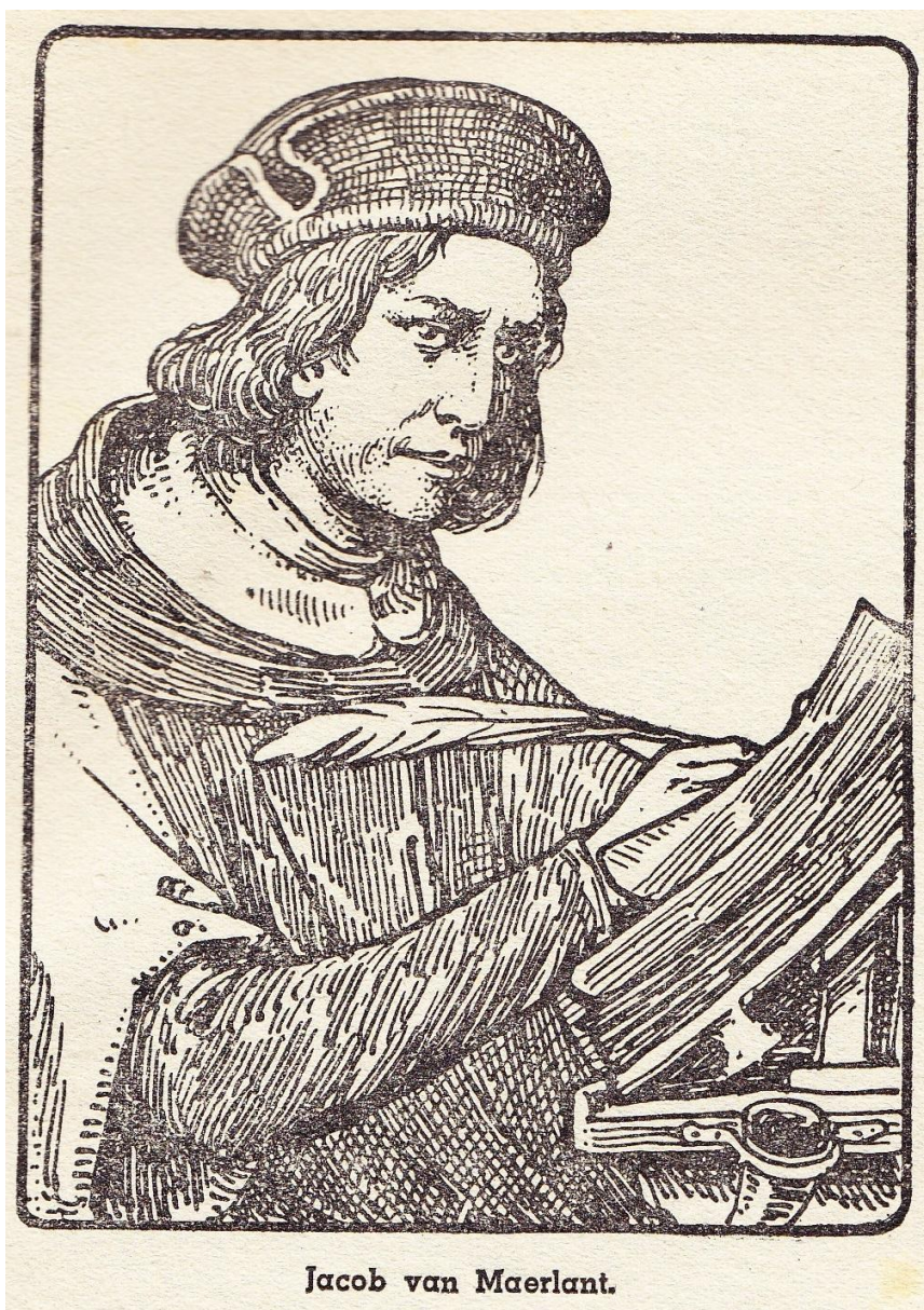
Jacob van Maerlant.

Pentekening bladzijde 128 / illustration page 128