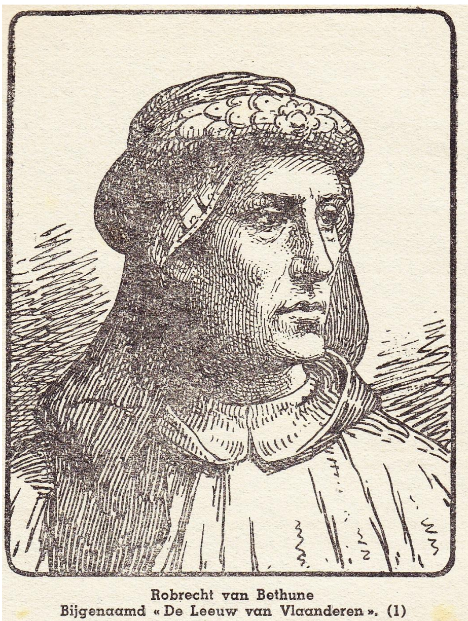
Robrecht van Bethune Bijgenaamd « De Leeuw van Vlaanderen ». (1)

Pentekening bladzijde 117 / illustration page 117